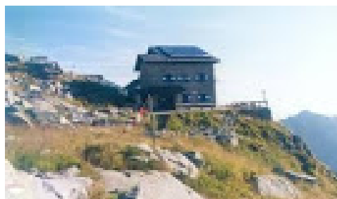
Rifugio Carè Alto (2459 m)